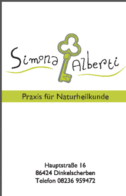
VISITENKARTE 2seitig hoch